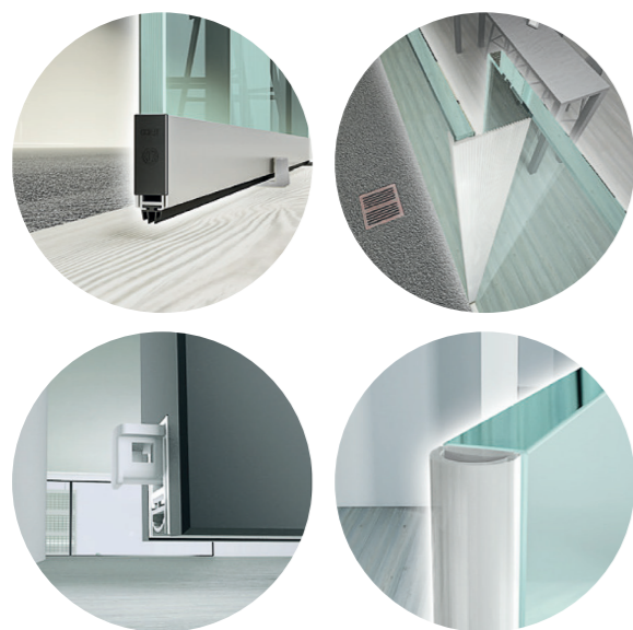
fot. akcesoria do drzwi przesuwnych

Nasze uszczelki to nie tylko detale – to komfort , bezpieczeństwo i elegancja , z których można korzystać przez lata.