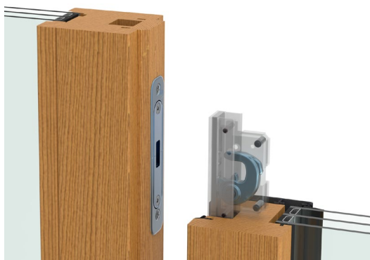
SCHEMAT DZIAŁANIA ZASUWNICY HAKOWEJ brak wystających z ramy elementów regulujących